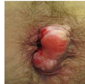
Abramowitz L. et al. Systematic evaluation and description of anal pathologies in HIV-infected patients during HAART era. Dis Colon Rectum. 2009 Jun;52(6):1130-6